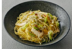
れんこんとさつまいものサラダ &ねぎとしらすのペペロンチーノ