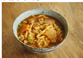
野菜たっぷり 味噌煮込みうどん