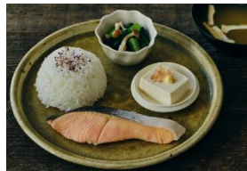
和風朝食プレート