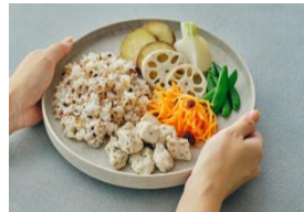
ヘルシーデリプレート