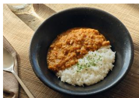
やわらかキーマカレー

*1 〔調査方法〕2026年5月時点で発売されている電気圧力鍋カテゴリーにおいて（自社調べ）