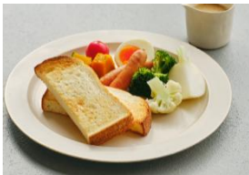
洋風朝食プレート