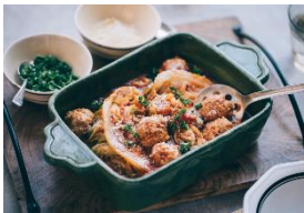
キャベツと肉だんごの トマト煮