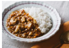
野菜たっぷりカレー