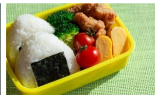
お弁当を冷ますのにも