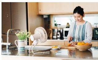
キッチンの暑さ対策に