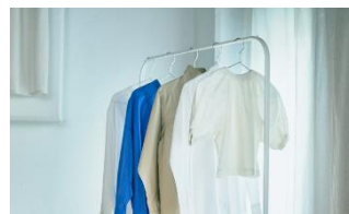
少量の室内干し乾燥に