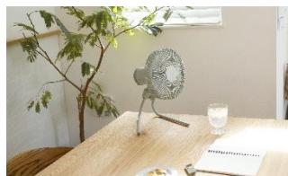
リビングの卓上で