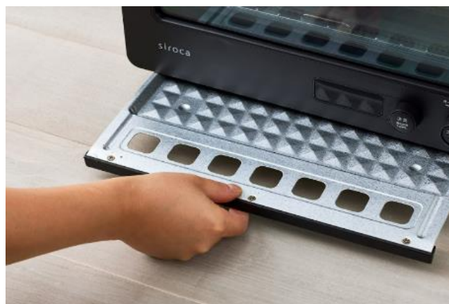
【画像②】取り外せるパンくずトレー