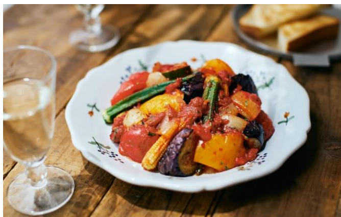
【画像②】パン以外の料理にも活躍。「スパイス香る夏野菜の焼きラタトゥイユ」