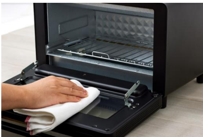
【画像①】扉が 90 度開閉するのでお手入れ簡単

焼き網を取り外せば扉が 90 度開閉するため、お手入れも簡単。パンくずトレーは取り外して手軽に洗えるので、いつでも清潔にお使いいただけます。様々な料理に活用していただきたいからこそ、お手入れのしやすさにもこだわりました。