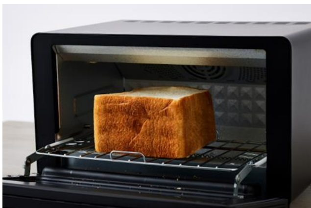
【画像①】10cm の庫内の高さで食パンは 1/2 斤サイズまで対応

本製品は 10cm という庫内の高さで、食パン 1/2 斤サイズまで対応。マニュアルモードの温度範囲は 40℃～280℃まで、時間は最大 90 分までと、メニューに合わせて幅広い設定が可能です。パンはもちろん、庫内の高さを活かしたお餅や、設定温度と時間の幅広さを活かしたオープン料理など、多彩な料理に活躍します。